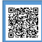
ホームページ QRコード

【利用方法】 予約は不要です。体調に不安のある場合には利用をお控えください。受付で体温を計測いたします。